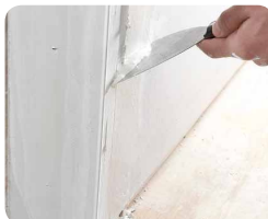
Step 4: Embeba a fita