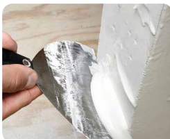
Step 1: Barre a esquina com massa