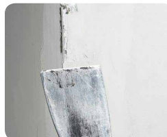
Step 5: Retire os excessos antes que a massa endureça