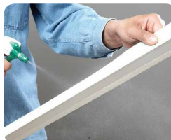
Step 2: Humedeça a fita