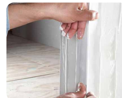
Step 3: Posicione a fita