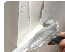
Step 6: Finalize com mais duas camadas de massa para juntas